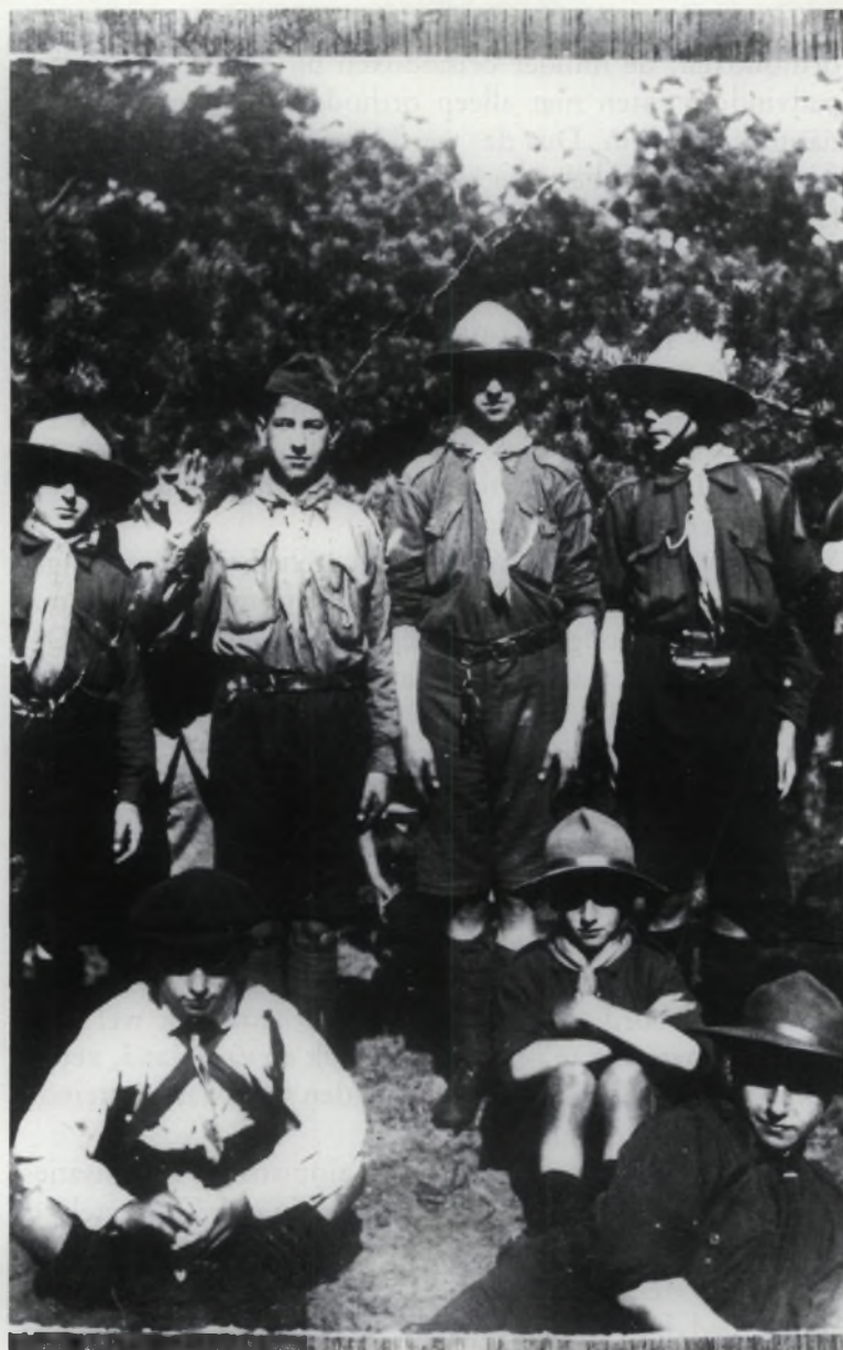
Wen zwei Bismarckjäger Wen Jäger und solche hat Wen die Bismarckjäger Wen die Bismarckjäger