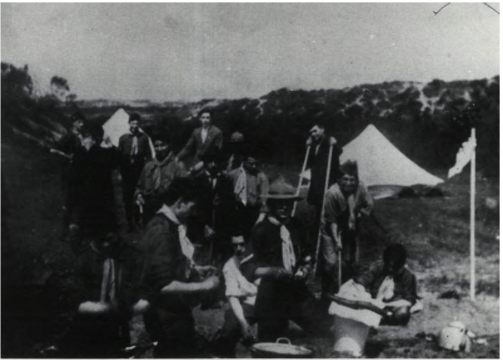
De joodse padvinderij Hasjoriem op kamp in 1915 (links en rechts).

begon: „Al zijn jullie ook honderdmaal joods ...” Met andere woorden: Jullie zijn wel minderwaardig, maar wij menen het toch goed met jullie. En hij meende het natuurlijk goed.