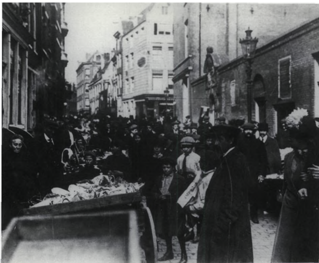
Zondagsmarkt in de Lazarussteeg waar armoede troef was.

geen groentewinkel laten zien, die enige gelijkenis heeft met het winkeltje waarin ik mijn jeugd heb doorgebracht. Het handigste is het te vergelijken met een winkel in een Arabische wijk van Israël: een sjinkeltje in de meest rechte zin van het woord. Zo zag het eruit. Er werden alle soorten groenten verkocht. Wat er werd verkocht was afhankelijk van het seizoen. De seizoenen golden toentertijd meer dan nu. Dus je had wortelen, rode kool, witte kool . . . Het werd per kool verkocht. Je kon niet zeggen: Geef me een kilo kool.