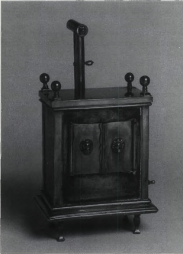
Klein model Sjabbesoventje.

Omdat ik vaak solo met hem zong, op vrijdag of op jontef, had ik de kowed van chazzan Reisel gekregen om hem een half uur voor Sjabbes in de Franselaan af te halen en zijn tas met muziek te dragen. Stel dat het om zes uur Sjabbes was en ik kwam om half zes bij hem, dan oefende hij nog even zijn stem bij de piano en als hij dan weg ging kreeg hij van zijn vrouw altijd een citroenballetje. Maar mij, als jongetje van tien, elf jaar, gaf ze er nooit één. Kwam ik thuis en vroeg mijn vader: „Heb je weer de chazzen geholpen?” dan klaagde ik