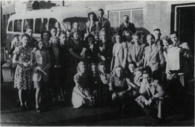
Een uitje met de Matzefabriek Hollandia, die ondermeer naar communistisch Rusland exporteerde.

we nog diezelfde dag op ons dak gedaan, zodat we droog zaten.