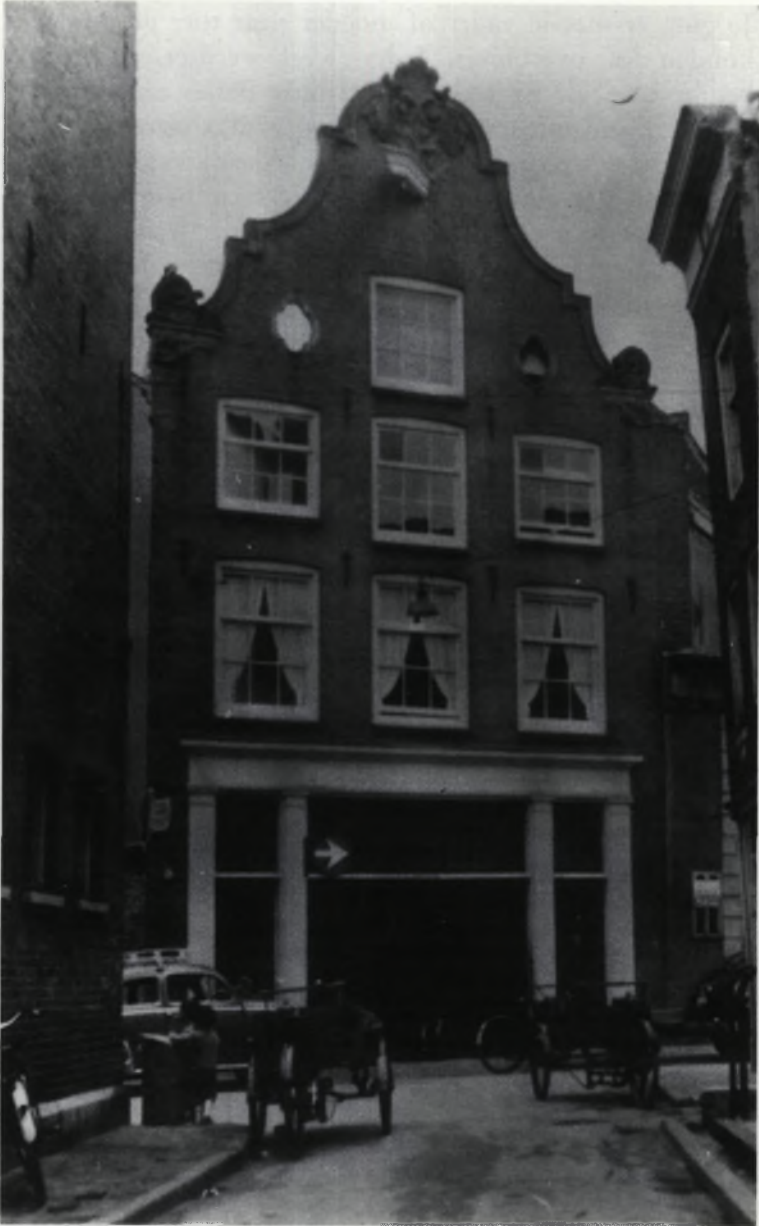
Zicht op de Keizerstraat, die op dit punt plaatsmaakte voor een ingang van de metro.